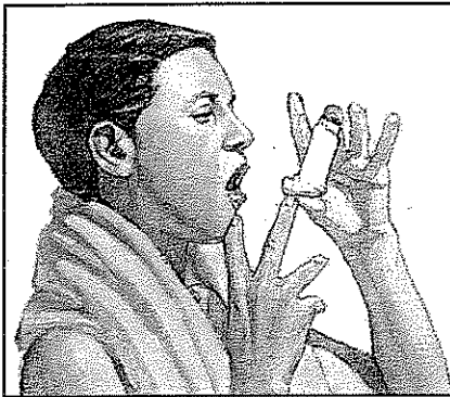
Open mouth with inhaler 1 to 2 inches away.