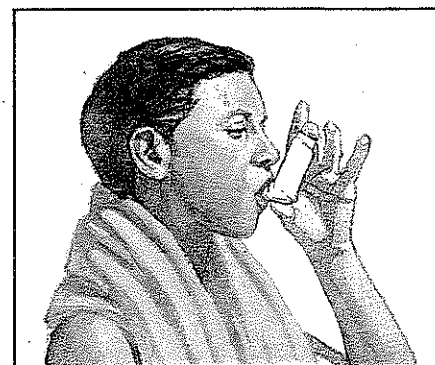
Apíquelo directamente en la boca.