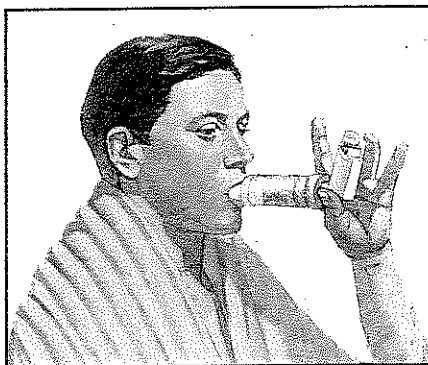
Utilice un separador (cámara de retención).