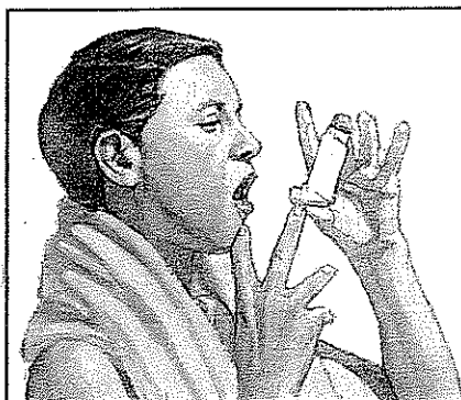
Abra la boca y aleje el inhalador de 1 a 2 pulgadas (3 a 5 cm).